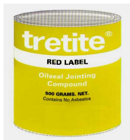
Massa p/ JUNTAS

IMPERMEÁVEL à acção da água petróleo, ácidos, alcalinos, e óleos a altas temperaturas e pressões, para juntas e flanges roscadas. para pressão de óleo até 1.000 p.s.i. e temperaturas até 300° C. Pode ser afinada c/ Álcool Desnaturado