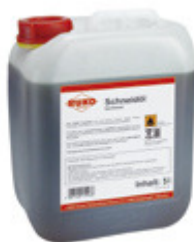
OLEO DE CORTE