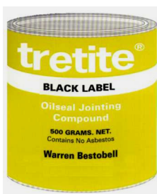
Massa de Grafite p/ JUNTAS

NÃO endurece - PROTEGE da corrosão - FACILIDADE nas desmontagens - SUPORTA a acção do vapor, água, e óleos a alta temperatura e pressão Pode ser afinada c/ ÓLEO de LINHAÇA