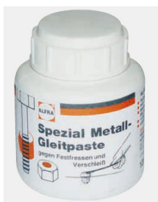
PASTA DE CORTE