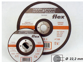
Discos abrasivos para rebarbar aços Furo : 22 mm