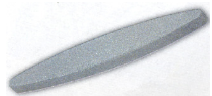
PEDRA DE ESMERIL AFIAR