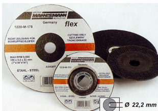
Discos abrasivos corte de aços INOX Furo : 22 mm