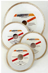
Disco Corte Diamante Integral Furo : 22.2 mm

Disco com lâmina contínua sinterizada Para azulejos, mármore, cerâmicas, granito delgado Alma em aço, largura do diamante 5mm Com aprovação DAS Pode ser utilizado para cortar a seco