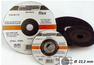
Discos abrasivos para corte de aços Furo : 22mm