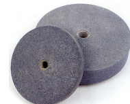
Rebolos para esmeriladora 0M1228