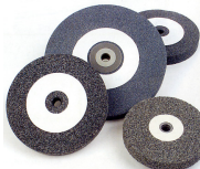
Rebolos para esmeriladora 0M1225 GRÃO FINO