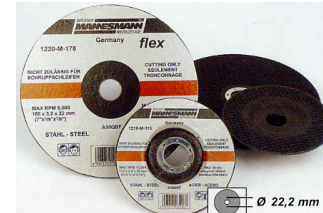
Discos abrasivos para corte de Pedra Furo : 22 mm