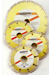
Disco Corte Diamante Segmentado Furo : 22.2 mm

Disco segmentado sinterizado Para corte de betão, telhas, ladrilhos e materiais de construção Alma em aço, largura do diamante 7mm Pode ser utilizado para cortar a seco